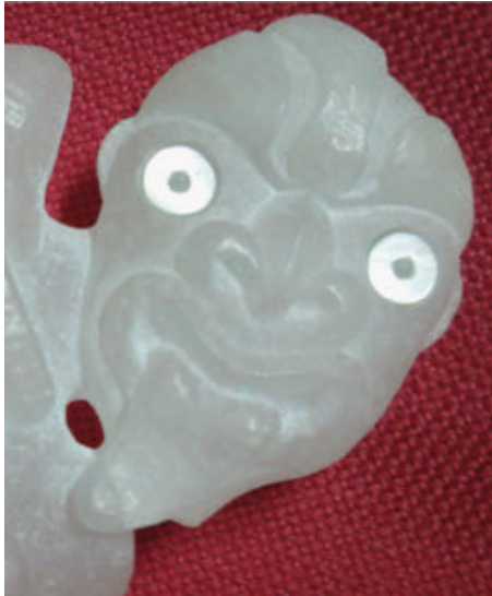
Los ojos brillan intensamente, son incrustaciones de nácar.

Para rellenar los ojos se utiliza, a veces, lacre – material de procedencia europea-. En otras ocasiones se utiliza el nácar procedente de la concha de abulón u oreja de mar–llamado paua en maorí-.