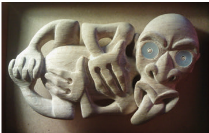
Hei tiki realizado en madera de haya con incrustaciones de nácar en los ojos. 5,6 X 10 cm .

Los objetos producidos tienen también carácter espiritual. Observamos esto, por ejemplo, en la fabricación de las canoas, que debían ser talladas lejos de las mujeres y del humo de los hogares y al abrigo de los vientos impuros y desfavorables. Relacionado con esta faceta espiritual encontramos un objeto peculiar: el hei tiki .